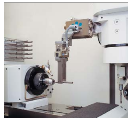
Rys. 4. System automatycznego podawania

Zapewniamy możliwość przeprowadzenia prób szlifowania w centrum szkoleniowym firmy SAACKE w Pforzheim (Niemcy).