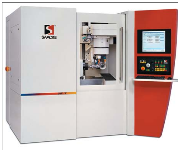
Rys. 1. Szlifierka SAACKE UWIF CNC

Przeprowadzone obliczenia i badania pozwoliły także poprawić sztywność maszyny, przy jednoczesnej znacznej oszczędności materiału.