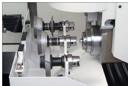
Rys. 3. Głowica szlifierska